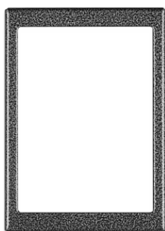
Listy opisowe dla ok. 6 lokatorów (CDN-6N)