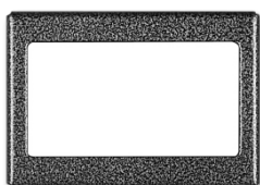
Listy opisowe dla ok. 5 lokatorów (CDN-5N)