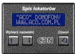
Elektroniczna lista lokatorów